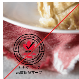
カナダポーク 品質保証マーク