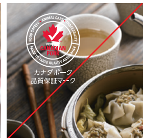
カナダポーク 品質保証マーク