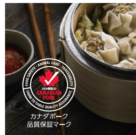
カナダポーク 品質保証マーク