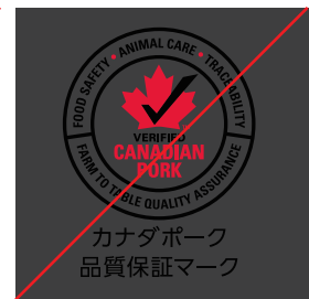
カナダポーク 品質保証マーク