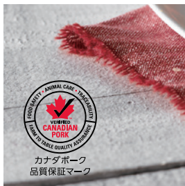
カナダポーク 品質保証マーク